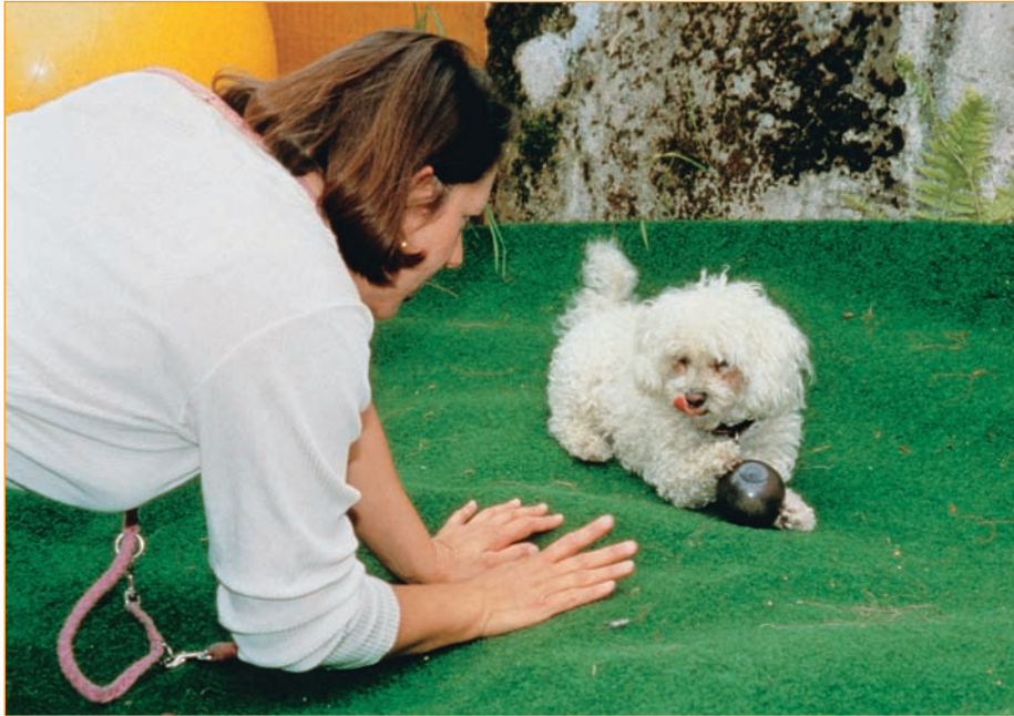
Auch die Häufigkeit, Intensität und Dauer von Konfliktreaktionen (hier im Bild das so genannte Züngeln) wurde als Bewertungsmaßstab in unserem Bindungstest herangezogen.

Nach dem derzeitigen Stand unserer Beobachtungen und Auswertungen (Videoanalysen) lassen sich als kurzgefasstes Endergebnis hauptsächlich drei verschiedene, nicht immer leicht abgrenzbare Qualitäten der Bindung und ihre jeweils zugehörigen Verhaltensäusserungen beim Hund, aber auch bei der Bezugsperson ableiten: